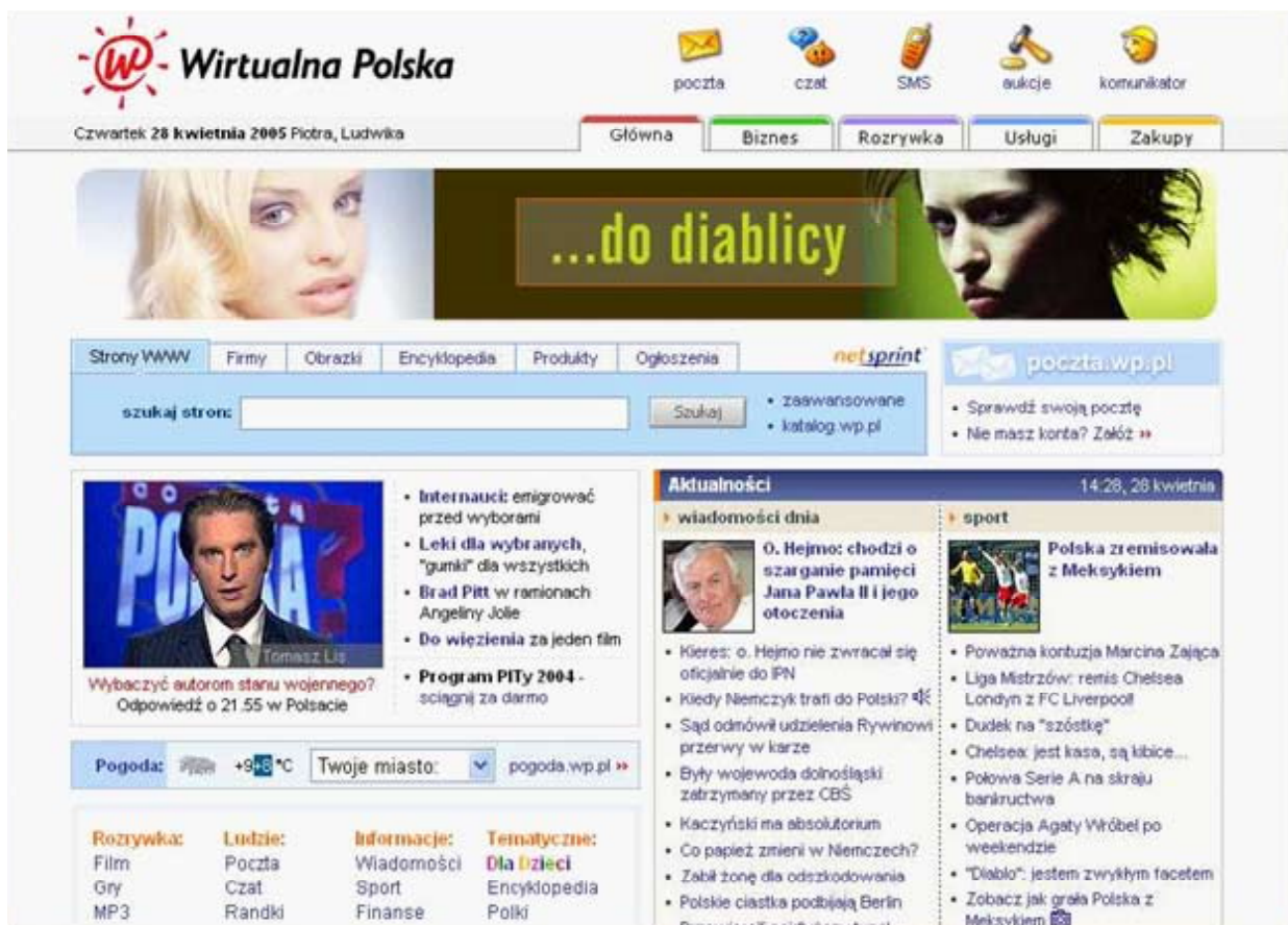
Rys. 4

Dominował styl składający się z ramek, zakładek, ozdobników, bannerów reklamowych i innych nadających stronie formę potężnego medium na którym znajdują się wszystkie informacje, począwszy od prognozy pogody poprzez najnowsze wiadomości sportowe a skończywszy na najważniejszych informacjach politycznych i plotkach dotyczących celebrytów.