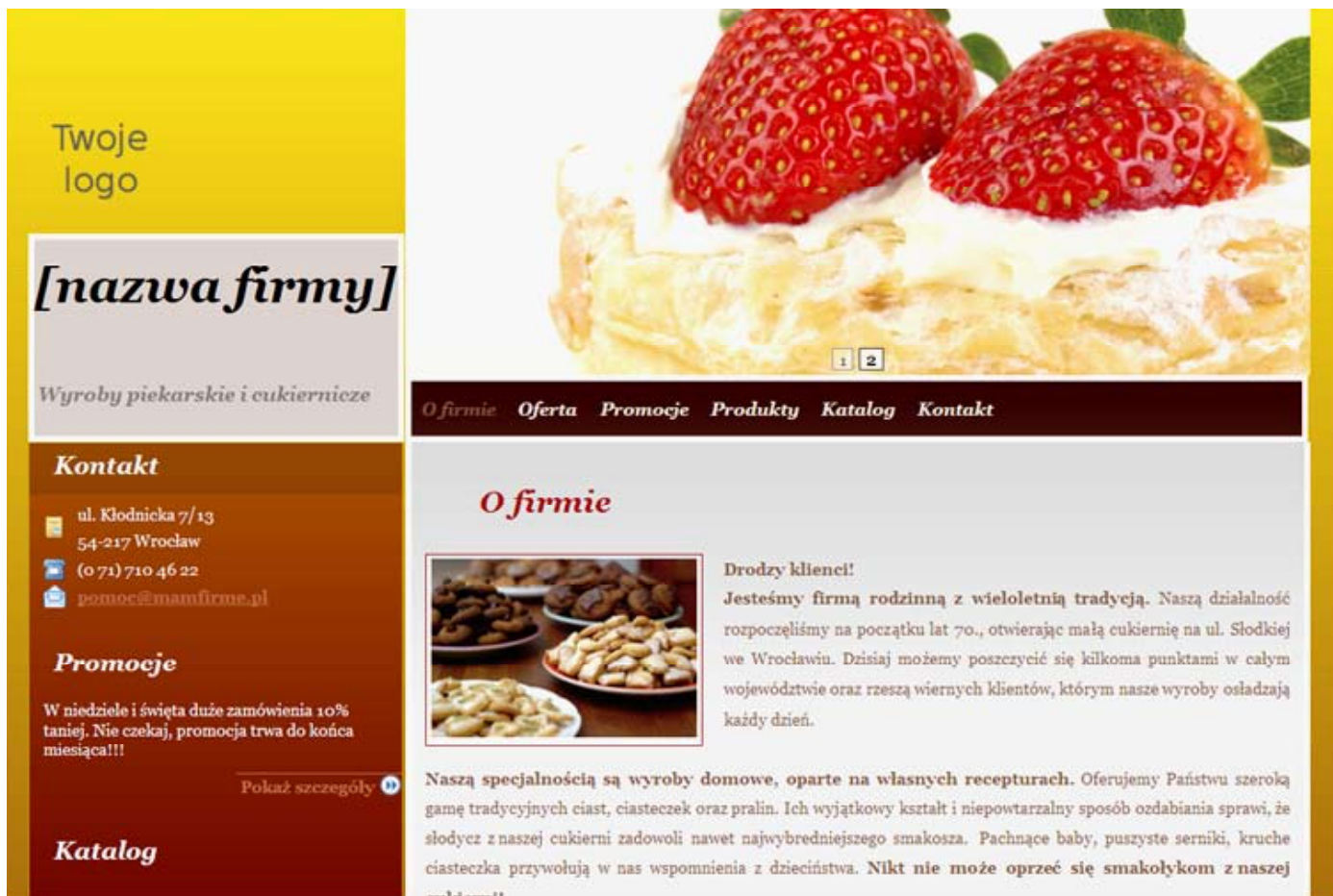
Rys. 5 [Przykład strony firmowej o branży spożywczej]